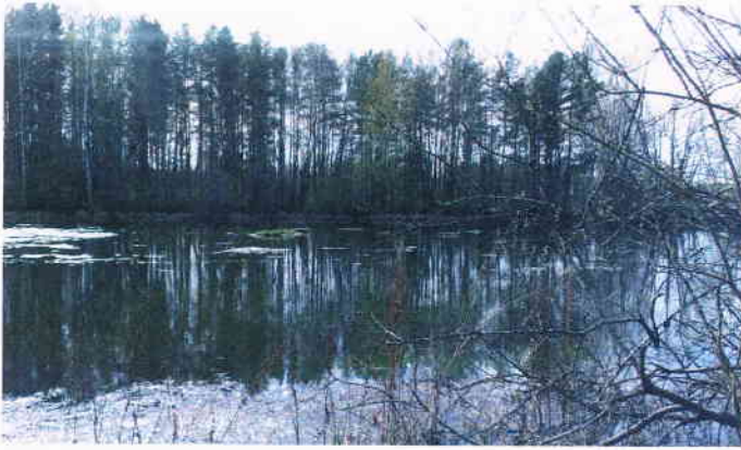
Fiskeundersøkelser er noe av kartleggingen som skal gjøres i Åkersvika