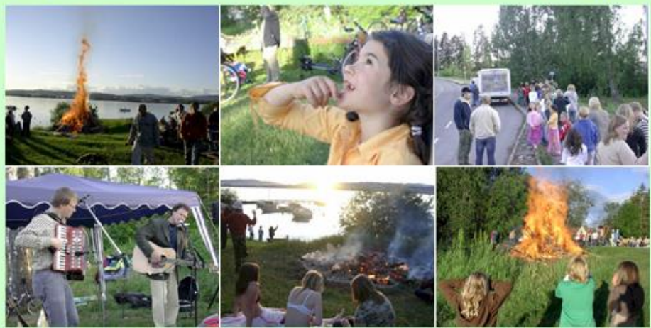
St. Hans-feiring i båthavna 2006 – bål, barn, musikk, fint vær og god stemning.

Har du lyst til å bo her? Nye boliger er under bygging – se prospekt for Sandvika Strand . Det er også nye boliger under bygging på Nedre Tømte og på "Fjetrehagan" .