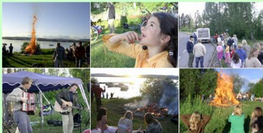
St. Hans-feiring i båthavna 2006 – bål, barn, musikk, fint vær og god stemning.

Har du lyst til å bo her? Nye boliger er under bygging – se prospekt for Sandvika Strand . Det er også nye boliger under bygging på Nedre Tømte og på " Fjetrehagan ".